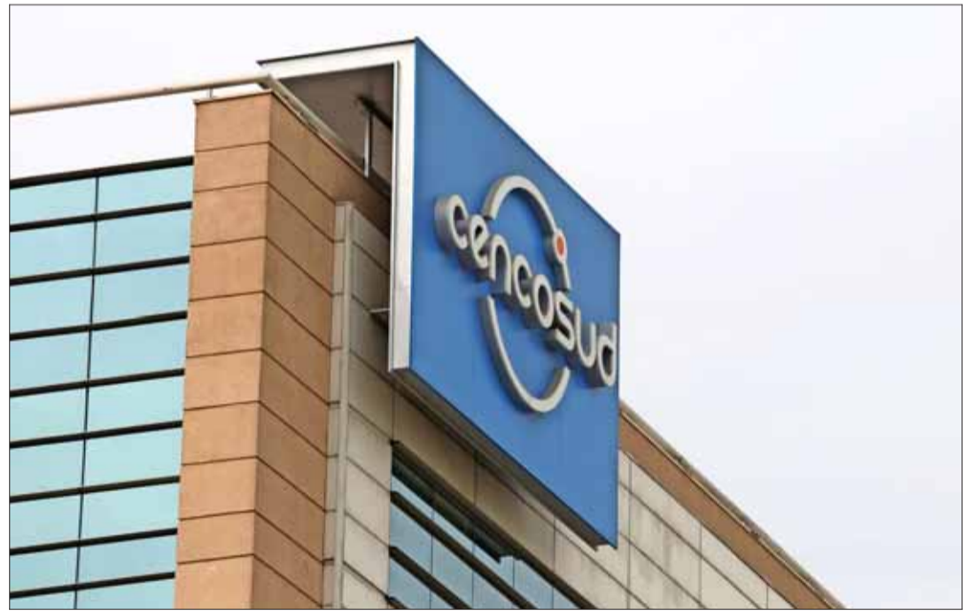
Cencosud tiene 24 horas para responder al oficio de la CMF.

“conforme a lo expuesto, por medio del presente, se le instruye a informar las medidas que adoptará para subsanar conforme a derecho lo expuesto, haciendo mención al antecedente y rectificando lo remitido, en lo que correspondiere. En su respuesta al presente oficio, que deberá remitir dentro de las 24 horas siguientes a la recepción del presente oficio, hará referencia al número y fecha del mismo”.