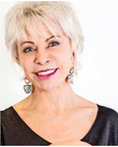
ISABEL ALLENDE LLONA (80):

Con más de 50 años de trayectoria, el periodista, comentarista y presentador de radio y televisión se ha posicionado como una de las voces más reconocidas de los hitos deportivos del país. Transmitiendo los grandes resultados nacionales a todos los chilenos y chilenas, el presentador actualmente es el comentarista del campeonato nacional de fútbol chileno. Durante su carrera fue reconocido con el Premio Nacional de Periodismo Deportivo de Chile en 1991 y con el Premio Carmen Puelma en 2009. Además, es el autor de "Caído del cielo" y "Me pongo de pie".