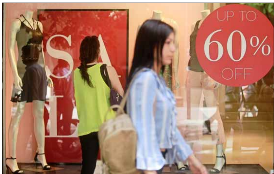
Expertos estiman que ante un elevado nivel de inventarios, los retailers deberán liquidar productos para "hacer caja".