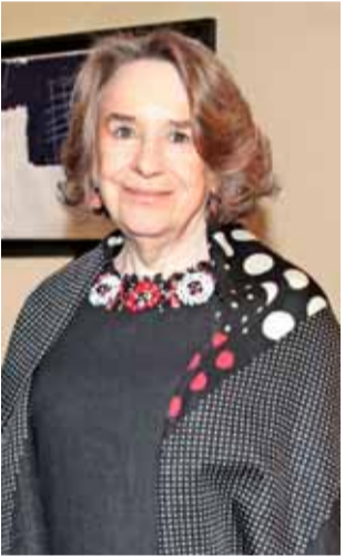
MARGARITA MARÍA ERRÁZURIZ OSSA (83)

Profesor Titular y Emérito de la U. de Chile. Cuenta con más de 100 publicaciones científicas, nueve libros y 50 capítulos, que lo hicieron merecedor del Premio Nacional de Ciencias Aplicadas y Tecnológicas el 2020. Sus descubrimientos han aportado a la mejora de la resistencia de las plantas frente a la sequía y al conocimiento de especies de desierto. En esa línea, ha aportado al medio ambiente con su trabajo en la captura de carbono de los suelos, beneficiando el futuro de las nuevas generaciones.