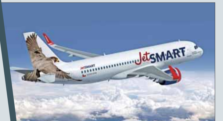
El propietario de JetSmart tiene participación en líneas aéreas de bajo costo.

Indigo Partners es reconocido globalmente por su participación en líneas aéreas de bajo costo internacionales. Actualmente cuenta con cuatro aerolíneas bajo esa estructura de negocio: Wizz Air en Europa del Este, Volaris en México, Frontier Airlines en Estados Unidos y JetSmart en Chile.