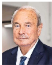
Heinz Hermann Thiele fue uno de los más ricos de Alemania.

La revista Forbes estima su fortuna en casi US$ 36.000 millones. Una inversión ganadora en Uruguay en parte de su patrimonio.