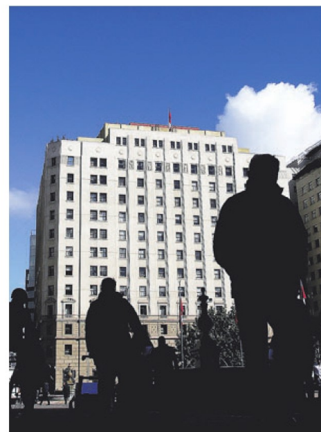
Ministerio de Hacienda.

El 30 de septiembre es el plazo para que Hacienda ingrese a tramitación el proyecto de Presupuestos.