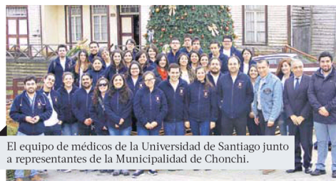
El equipo de médicos de la Universidad de Santiago junto a representantes de la Municipalidad de Chonchi.