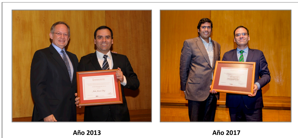
Fotografía 2: Mejor Profesor Part-Time de Ingeniería Industrial