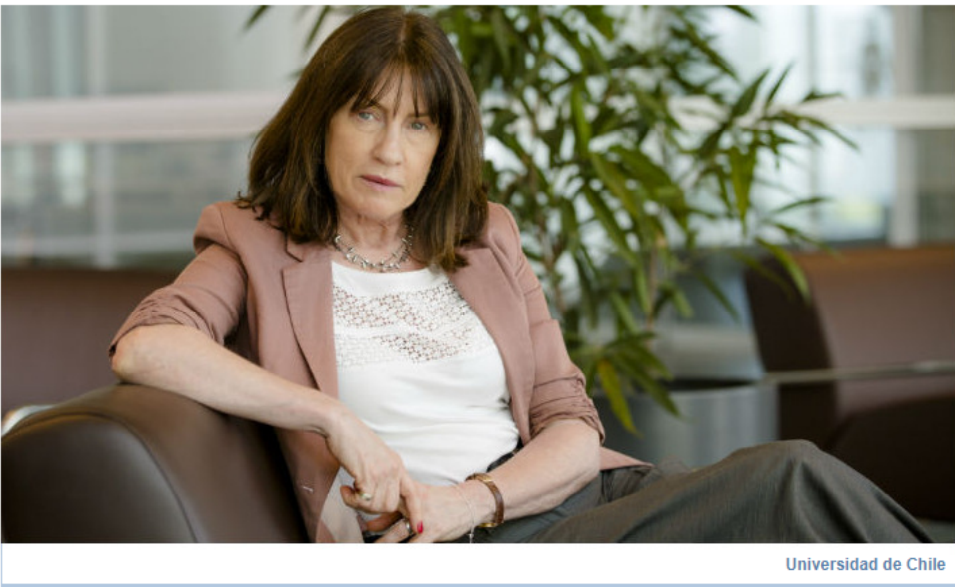
Universidad de Chile