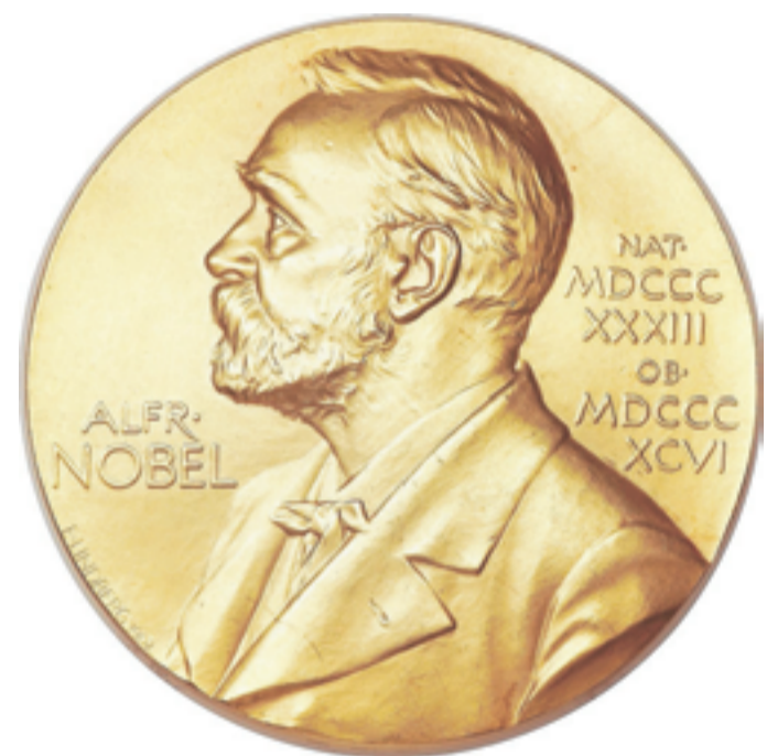
Tirole recibirá un premio de 8 millones de coronas suecas (US$1,1 millón).

fama mundial con su libro súper-ventas sobre la desigualdad: Capital en el Siglo XXI.