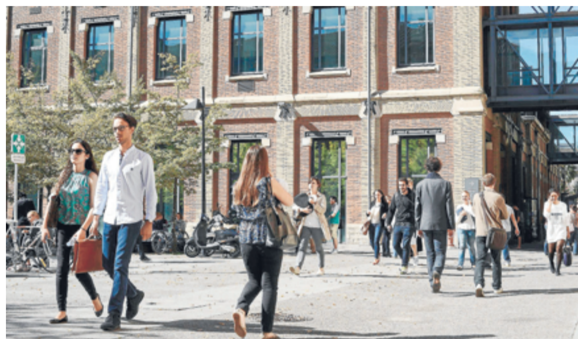
El laureado es profesor de la Escuela de Economía de Toulouse, Francia.