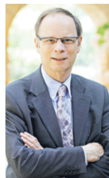
JEAN TIROLE Premio Nobel de Economía 2014

Revisa en tu iPad el resumen de la Real Academia de Ciencias de Suecia con los aportes de Tirole.