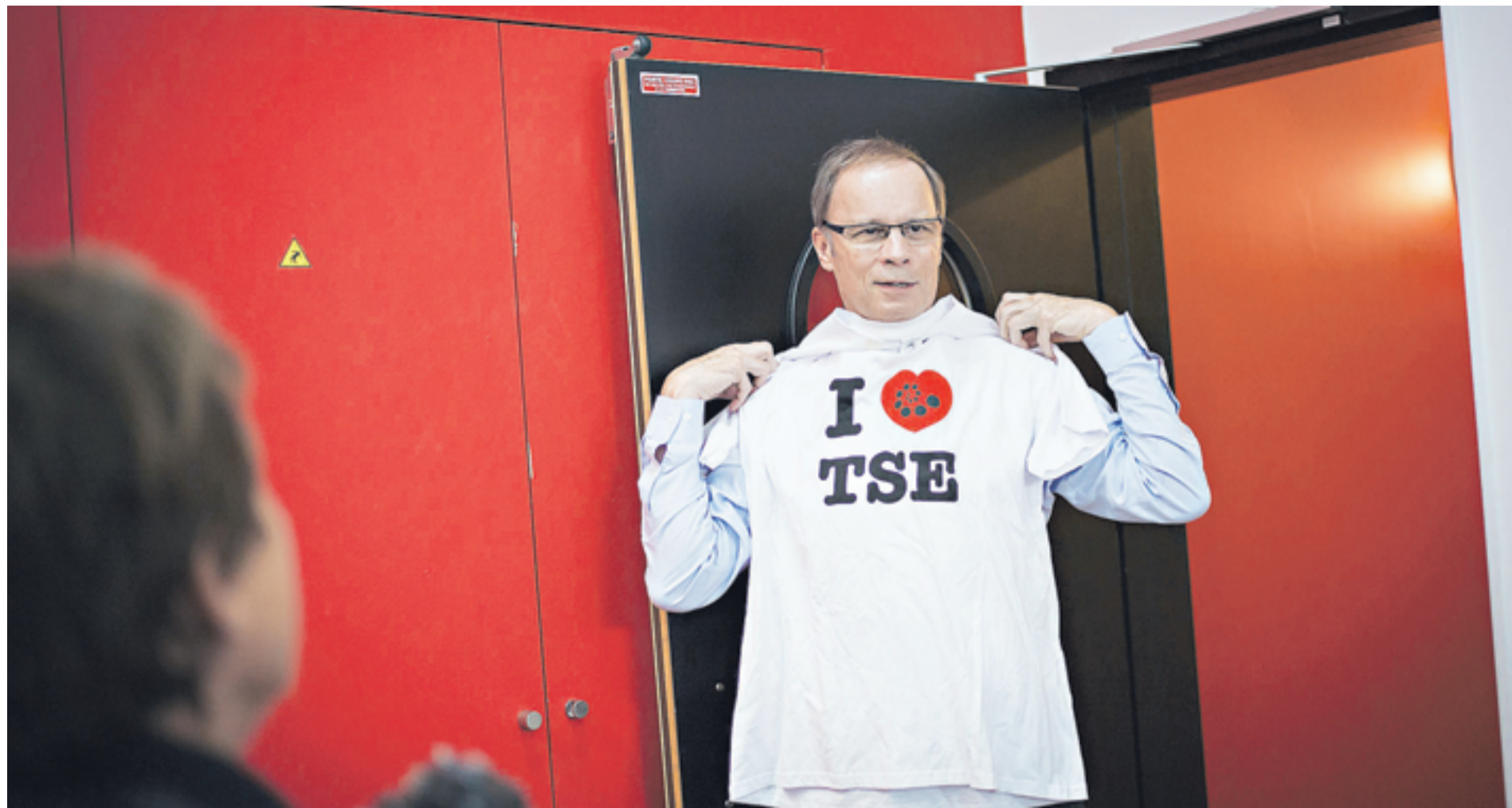
El ganador del premio tras una conferencia de prensa con una polera de la Toulouse School of Economics.